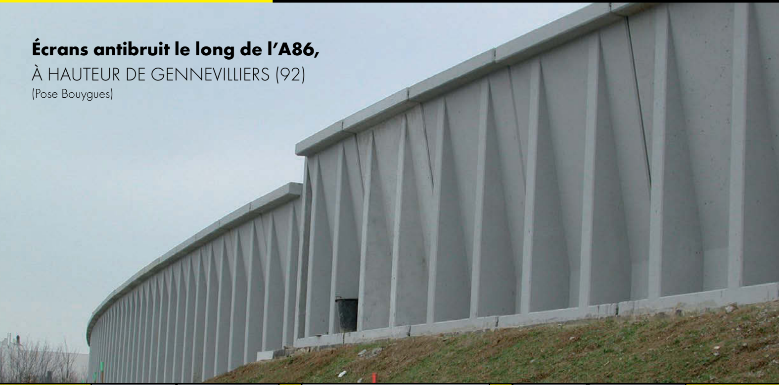
Écrans antibruit le long de l'A86, À HAUTEUR DE GENNEVILLIERS (92) (Pose Bouygues)