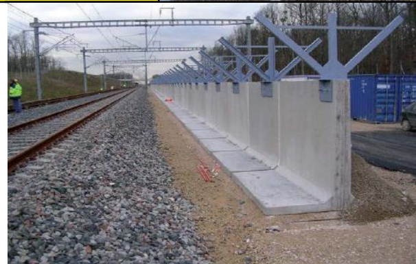
Mur antibruit LGV-EST (Pose TE-GE-VE)