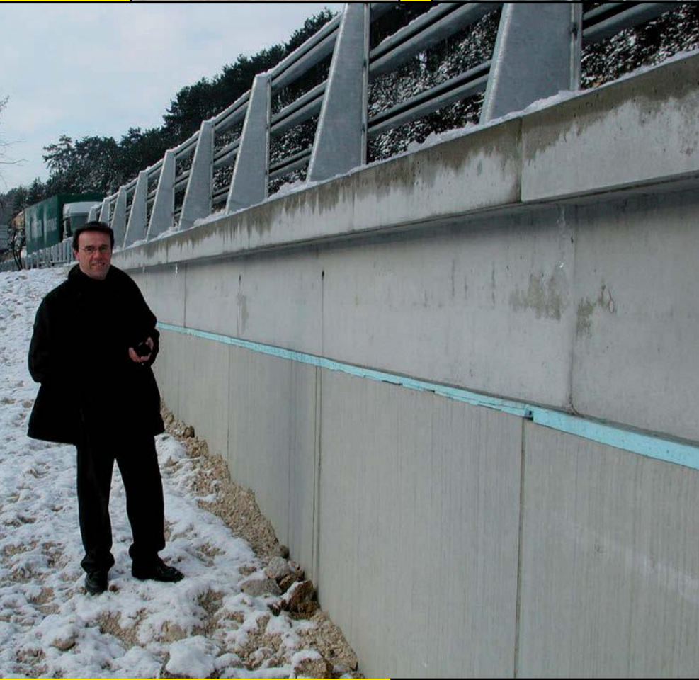
Murs avec Dalles de Frottement CHAPSOL ET BARRIÈRE DE SÉCURITÉ, Le long de l'Autoroute METZ-NANCY À HAUTEUR DE MAXEVILLE (54) (Pose Valérian)