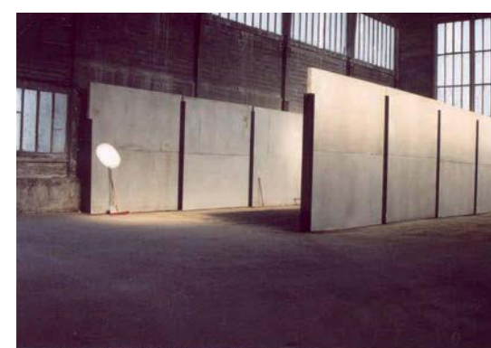
Panneaux préfabriqués insérés entre poteaux métalliques servant de parois de stockage d'engrais (Pose assurée par le client)