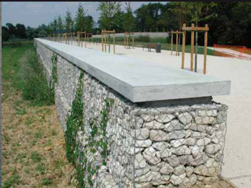
Murs de grande hauteur 8,00 m Parement matricé bois CHENNEVIÈRES SUR MARNE (94) (Pose NEC)